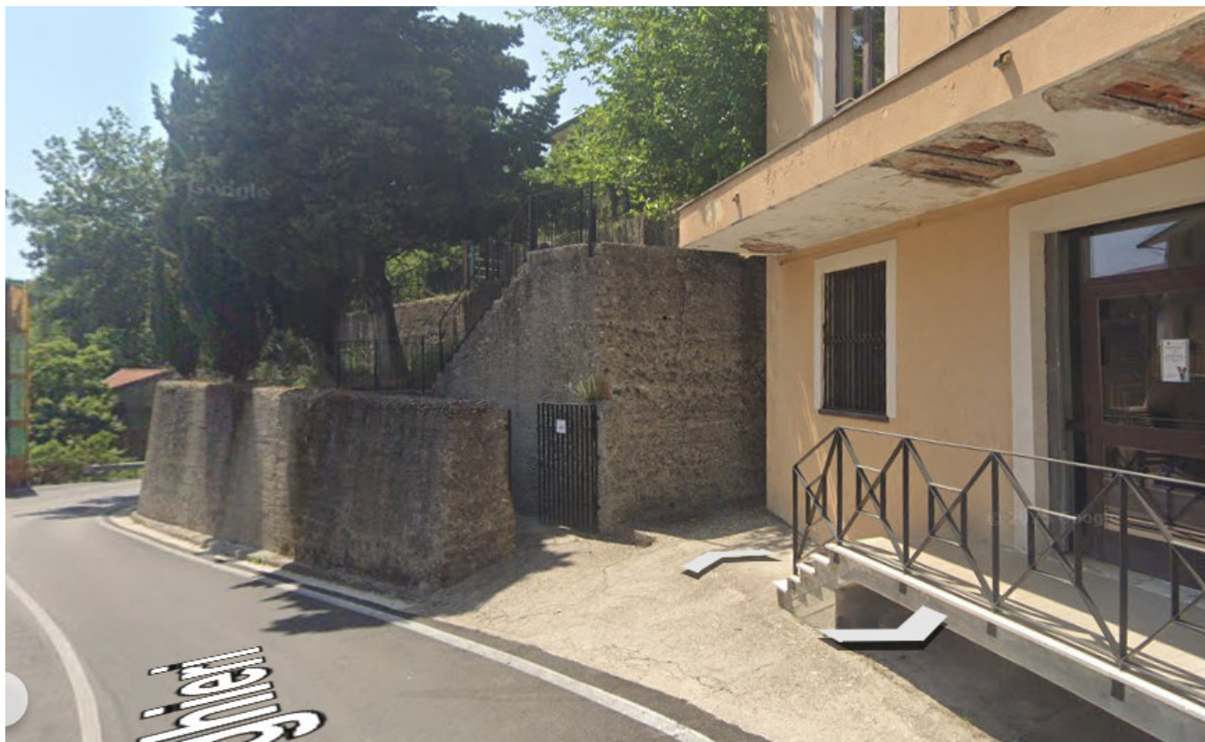
VIA DANTE ALIGHIERI FOTOGRAMMA SCORCIO