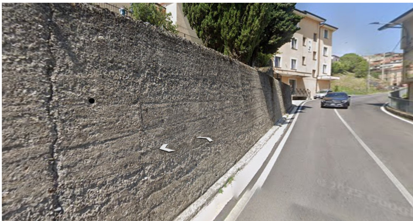
VIA DANTE ALIGHIERI FOTOGRAMMA SCORCIO